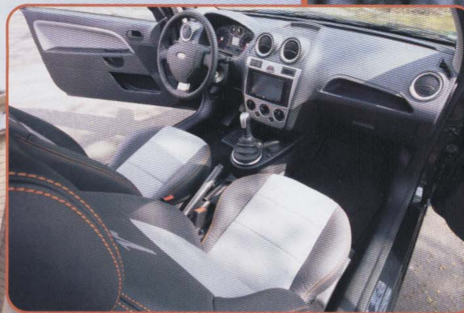
Optisch unauffällig, klanglich super