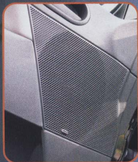
Für die ovalen Koaxe wurde von 5 x 7 auf 165 mm adaptiert