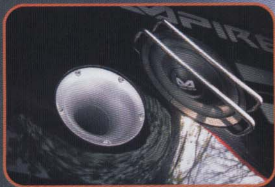
Die Bestandteile des Gehäusesubwoofers wurden im Kofferraum einzeln verbaut