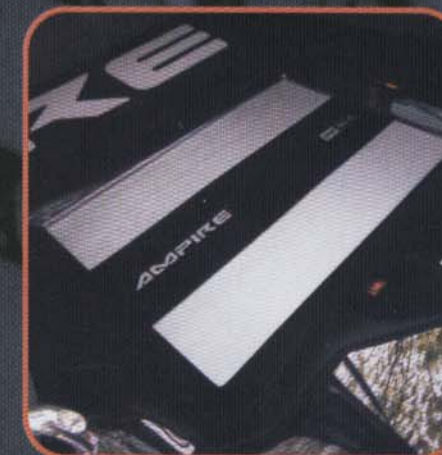
Ein einziger Verstärker versorgt die gesamte Anlage