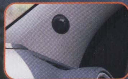
Gute Bühnenabbildung ohne großen Aufwand