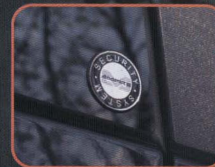
Schreckt Langfinger schon vorher ab

und Pianoklänge bieten Substanz und Detailreichtum. Auch rockige Klänge liegen der Anlage, und der für diesen Einbau auseinandergebaute kleine 25er-Subwoofer im 22-Liter-Bandpassgehäuse macht seinen Job ganz hervorragend. Verstärker und Woofer wurden in eine schräg stehende Platte eingesetzt und diese mit GFK und Metallic-Partikeln im Lack veredelt. Händler und Publikum waren begeistert und viele fragten nach einzelnen Subwooferkomponenten. So entschloss man sich bei Ampire, den 25er und 30er schon sehr bald in