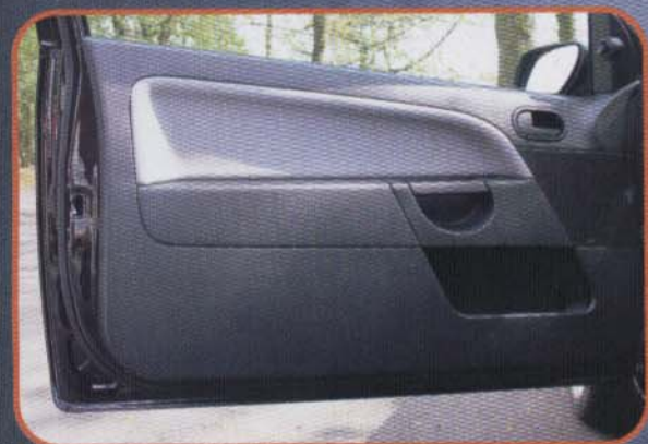
In den vorderen Türen wurden die Originalplätze genutzt