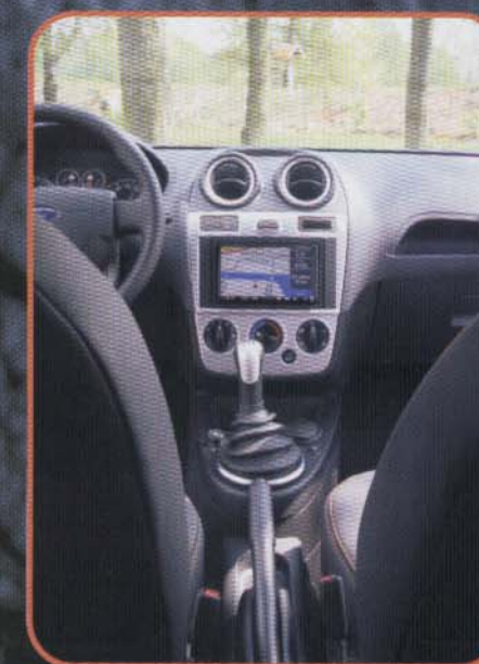
Das Kenwood Doppel-DIN-Gerät fügt sich optisch wunderbar ein