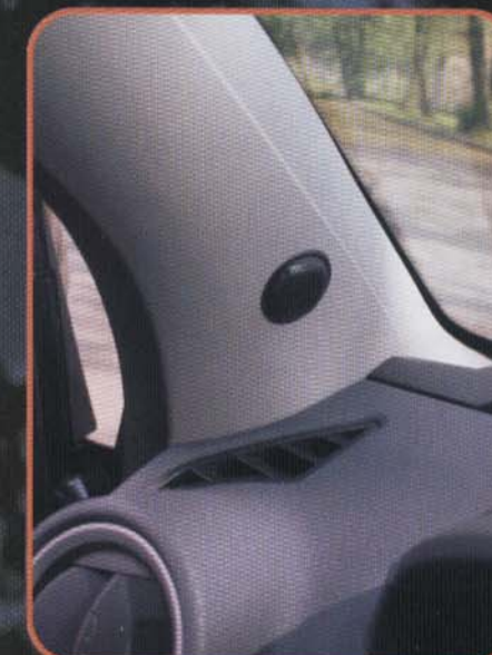
Ein kleines Loch in der A-Säule und die Bühne steht